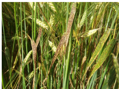
Billede 7. Ramularia. Her ses meget sene angreb.