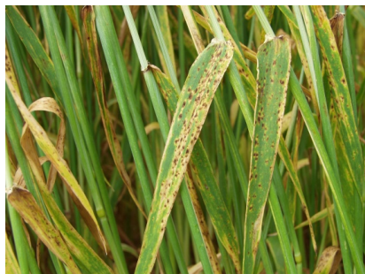
Billede 6. Ramularia. Svampen tillægges endnu mindre betydning i Danmark, fordi angrebene kommer sent.