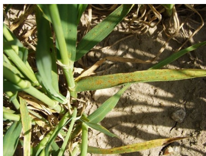
Billede 2. Bygrust på de nederste blade.