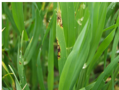
Billede 3. Bygbladplet optræder både som plettypen og nettypen. Nettypen, som ses på billedet, er langt den mest udbredte.