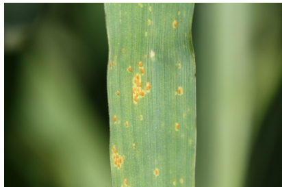
Billede 1. Nærbillede af bygrust.

Sprøjtefristen for svampemidler i vinterbyg ligger i intervallet 35 til 49 dage, mens Folicur/Orius, Bumper/Tilt og Zenit senest må anvendes i vækststadium 65 (blomstring halvvejs) og Tern senest i vækststadium 51.